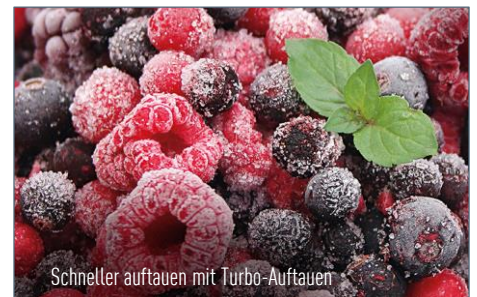
Schneller auftauen mit Turbo-Auftauen