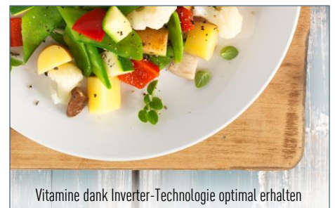
Vitamine dank Inverter-Technologie optimal erhalten