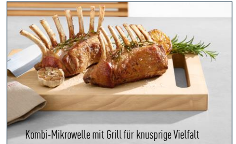
Kombi-Mikrowelle mit Grill für knusprige Vielfalt